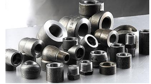
BORU BAĞ. PARÇ.