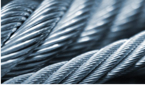
DEMET, TEL, HALAT