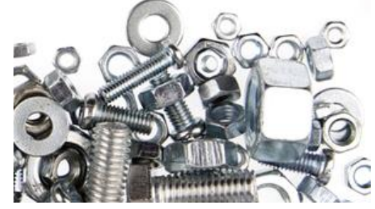
VİDA, CİVATA, SOMUN