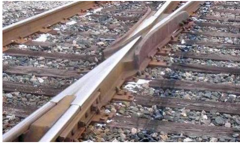
RAY MALZEMELERİ (BAZILARI)